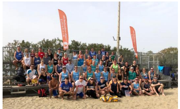
Teilnahme am Beach-Camp in Side/Türkei

Kondition wieder aufzubauen! So fand sich ein besonders motivierter Trupp MTVler im Flieger in die Türkei wieder, um an einem gemeinsamen Beachvolleyball-Trainingscamp mit Spielern und Spielerinnen aus ganz Deutschland teilzunehmen. Zusammen mit dem aktuellen Nachwuchs-Bundestrainer Paul Becker wurde an so mancher Angriffstechnik gefeilt und der eine oder andere taktische Spielzug ausgeklügelt