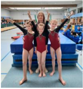
Meisterschaften - einzel