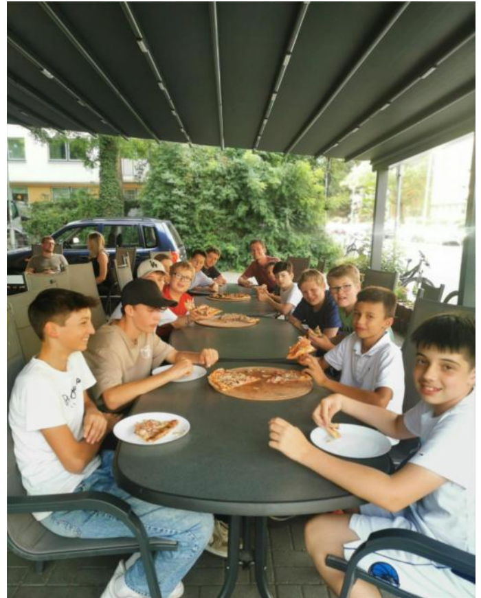
Meisterfeier U15 I + II

Sehr stolz sind wir besonders auf die Vielzahl an Jugendmannschaften, die wir jedes Jahr für die Medenrunde melden können. Im Jahr 2022 sind insgesamt 10 Jugend-Mannschaften für uns an den Start gegangen: