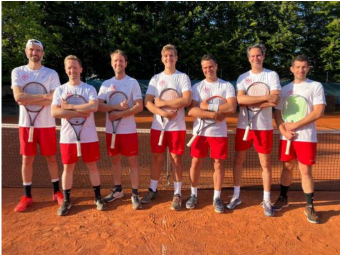
Herren 30 2022

Auch die Damen 55 schafften den Klassenerhalt in der Rhein Hessenliga.