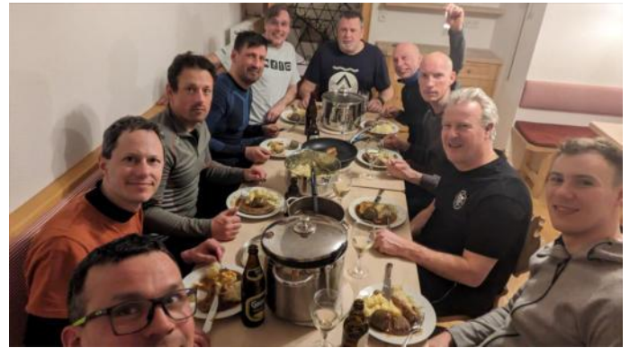
Essen am Pfälzer Abend