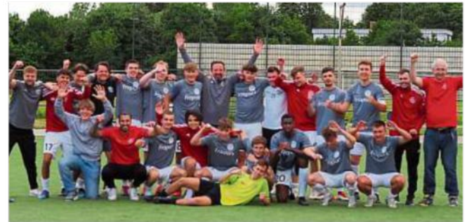
Die U 19 des TV 1817 Mainz feiert den Aufstieg in die Regionalliga Südwest.