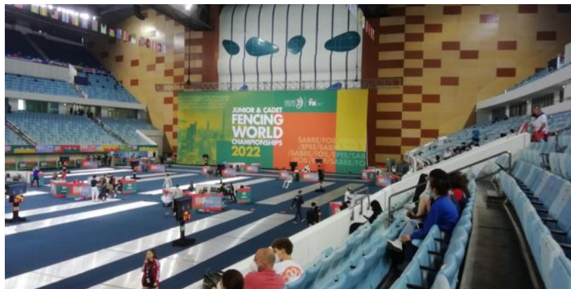
WM 2022 in Dubai. Und der MTV ist dabei.